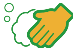
手洗い 手指衛生の徹底