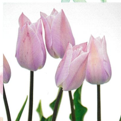
富山県花卉球根農業協同組合長賞 吉岡 公成

富山県育成のオリジナル品種。 真っ白な雲を想わせる聡明な姿が印象的。 花壇に向いている。 花形 一重咲 草丈 40~60cm 開花 4月中旬