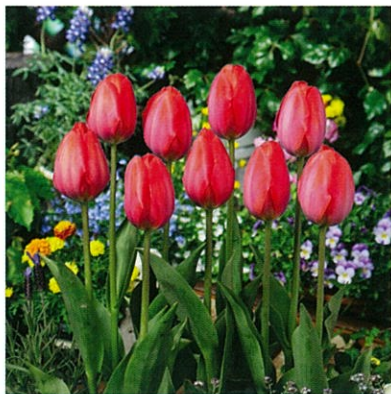
農林水産大臣賞 株式会社 清都

皇室献上チューリップは富山県チューリップほ場品評会にて上位入賞の生産者が丹精こめて作った球根をセレクト。本品評会は球根ほ場の生育・病害・管理や球根の品質・収量等を審査し、その中でも最も優秀な生産者には農林水産大臣賞が授与されます。本賞は明治神宮にて行われる秋の新嘗祭に招待される名誉ある賞です。品質の高い富山県産チューリップの中でも名実ともに選ばれた最高級の球根と言えるでしょう。