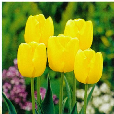
北陸農政局長賞 農事組合法人 目川

赤味のあるオレンジ色。 ぽっくりとした花形が愛らしい。 花壇・鉢植えにも向いている。 花形 一重咲 草丈 20~40cm 開花 4月上旬