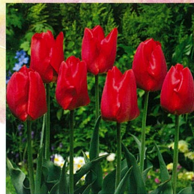
富山県知事賞 高島 宗雄

富山県育成のオリジナル品種。 明るい色合いの大きな花で花持ちは抜群。 草丈が低く鉢植えにも向いている。 花形 一重咲 草丈 20~40cm 開花 4月中旬