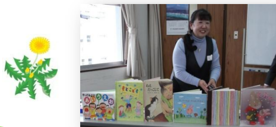
(経田先生と紹介絵本)