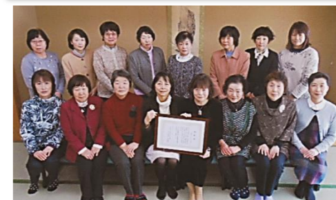
砺波市青少年健全育成指導者団体表彰受賞