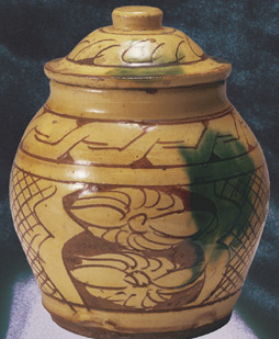
《ガレナ釉蓋壺》1922 益子参考館蔵