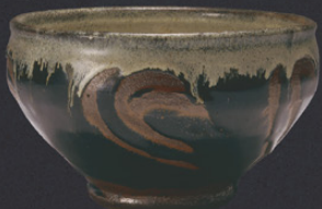
《掛分指描鉢》 個人蔵