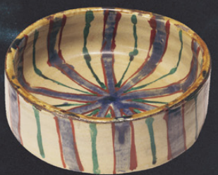
《琉球窯具須赤絵銅鑼鉢》1968 益子参考館蔵