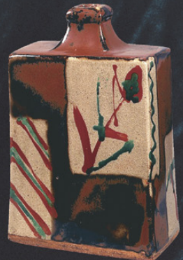
《柿釉赤絵角扁壺》1976 川崎市市民ミュージアム蔵