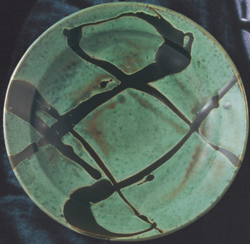
《青釉黒流描大鉢》1956 日本民藝館蔵